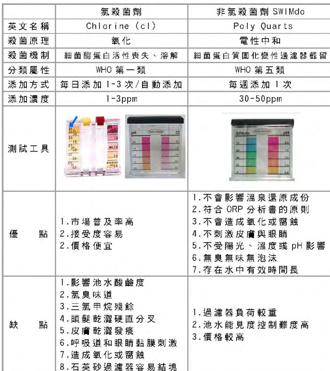
台灣省醫藥衛生標準消毒方法